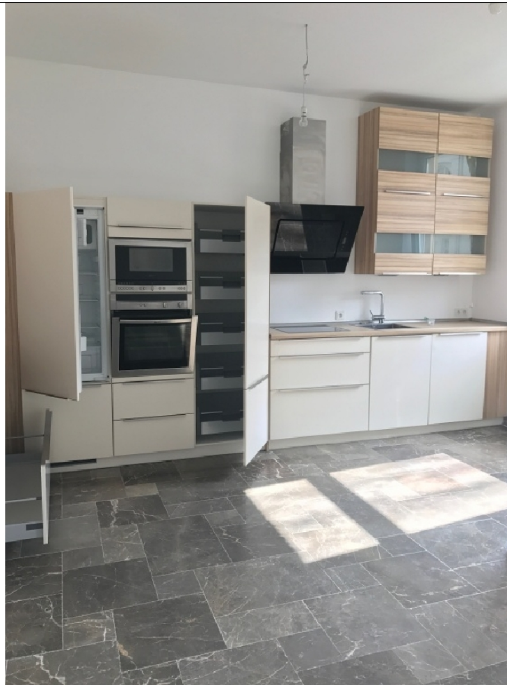
Zusatzbild für Galerie

ROT GmbH Buero: Klosterstrasse 21 32545 Bad Oeynhausen Tel: 01605000179 Fax: 05731-1531404 E-Mail: info@bo-immo.de