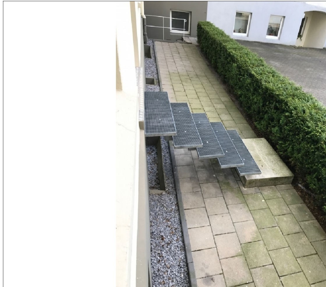
Zusatzbild für Galerie