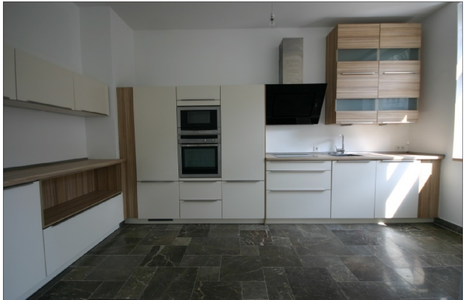
Zusatzbild für Galerie

ROT GmbH Buero: Klosterstrasse 21 32545 Bad Oeynhausen Tel: 01605000179 Fax: 05731-1531404 E-Mail: info@bo-immo.de