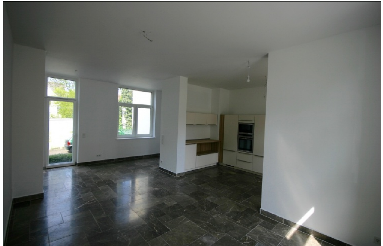
Zusatzbild für Galerie

ROT GmbH Buero: Klosterstrasse 21 32545 Bad Oeynhausen Tel: 01605000179 Fax: 05731-1531404 E-Mail: info@bo-immo.de