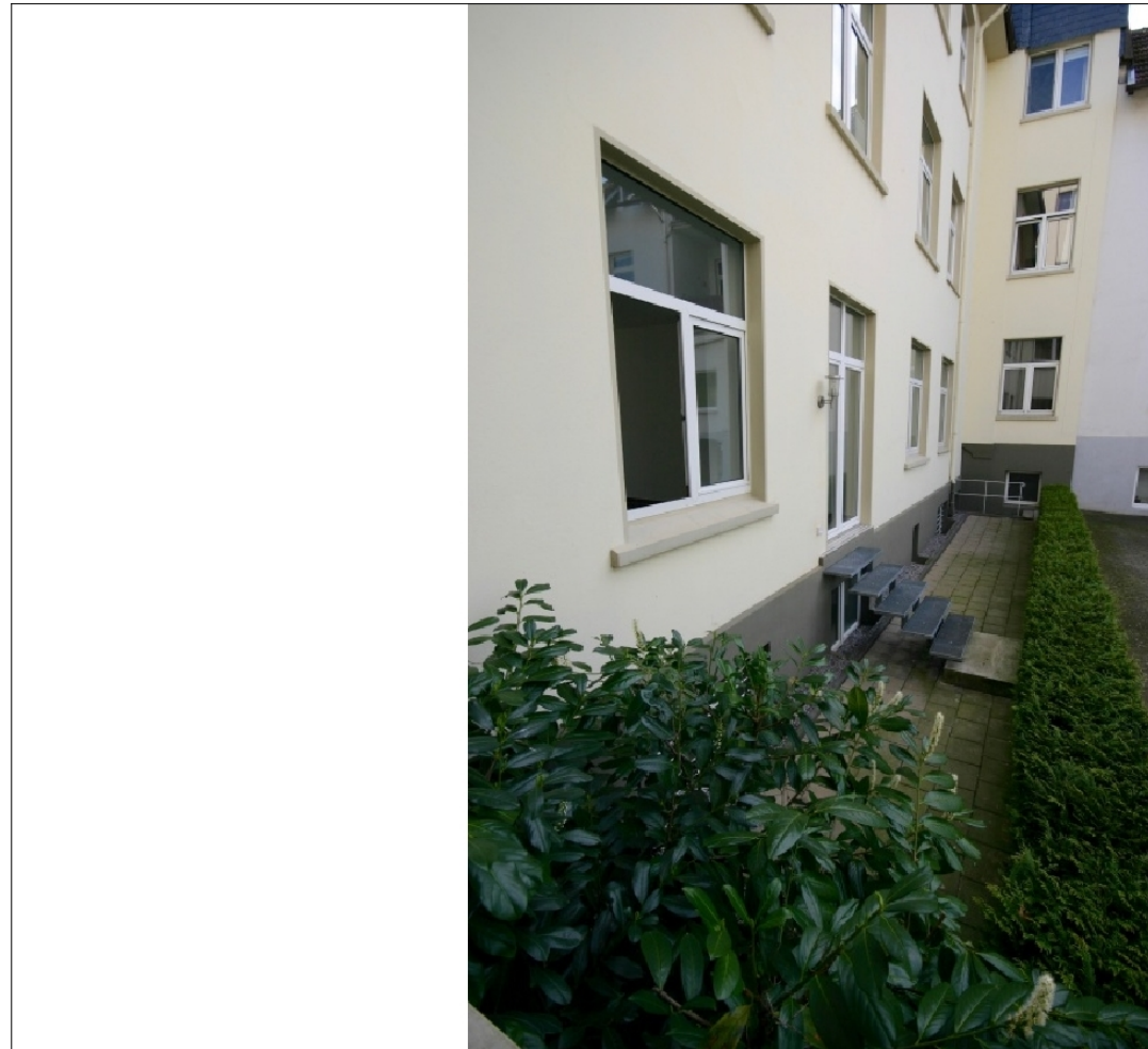
Zusatzbild für Galerie